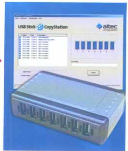
Software und USB 2.0 Hub – der Hardwareteil der USB Stick CopyStation