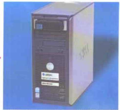
High-Speed CopyStation mit Memory Stick PRO Duo CardBox